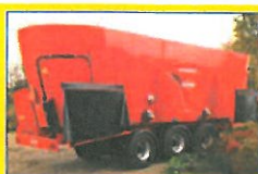
KUHN EUROMIX 12870-4570 3 vertikale snegle. Udfodring via luger. Bogie eller triple-akser.