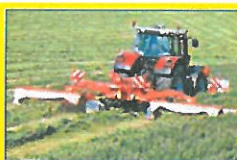
KUHN FC 8830 OG FC 3125F Skårteggere, Tripelsæt på 8,80 m, ProtectaDrive, Lift Control, FastFit knivskift og crimper