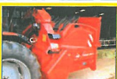
KUHN PRIMOR 2060 S Rumindhold 2 m 3 , 89 hk Kraftbehov, liftophængt. Til firkant- og rundballer