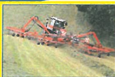
KUHN GA 15131 RIVE Bugseret, 9,50-14,70 m, 3D hjulophæng, G3 rotorer, hydr. højdejustering, centerskær